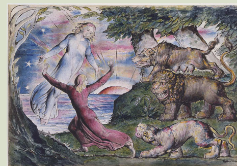
© The National Gallery of Victoria

Depois da sua morte, Catherine continuou a vender os trabalhos do marido, ajudando-a a sustentar-se por uns anos. Depois da morte dela, os trabalhos não vendidos foram deixados com Tatham, pertencente ao seu círculo de amigos, que alegadamente os destruiu.